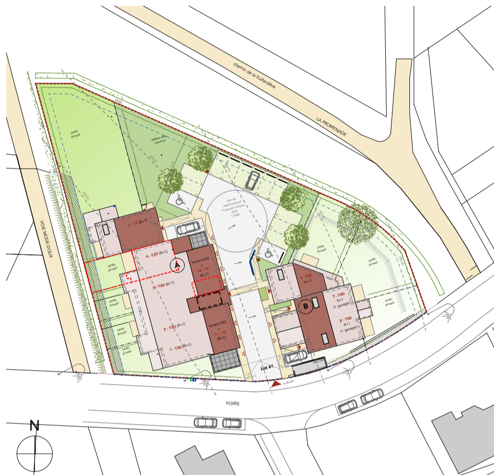
Tableau des surfaces