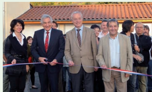
Inauguration Lagnieu « Les Coquelicots » Octobre 2011

Pour répondre aux attentes actuelles des locataires, nous construisons de plus en plus de pavillons. Les logements individuels représentent aujourd'hui plus d'1/3 de notre parc. Cela correspond également à la demande des communes de notre territoire.